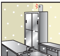
② 広さに合わせて 専用デバイスを設置