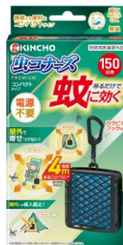
コンパクトタイプ