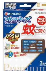
アミ戸に貼る タイプ