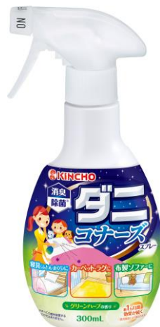
ダニコナーズ スプレー