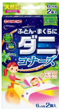
ふとん・まくらに ダニコナーズ