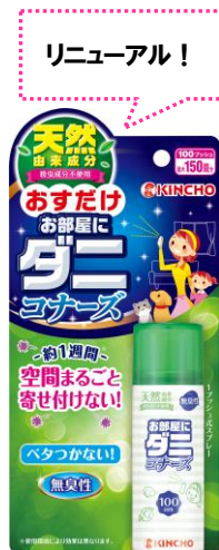
おすだけ お部屋に ダニコナーズ