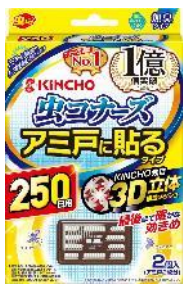
アミ戸に貼るタイプ