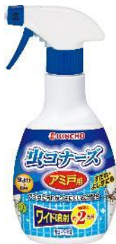
アミ戸用スプレー