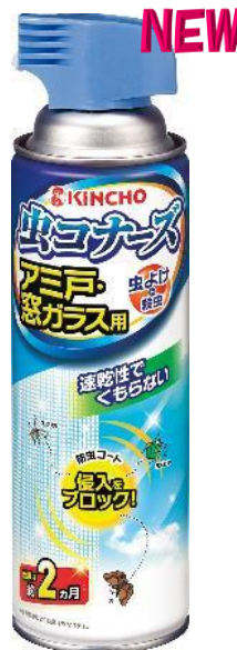
アミ戸・窓ガラス用スプレー