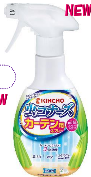
カーテン用スプレー