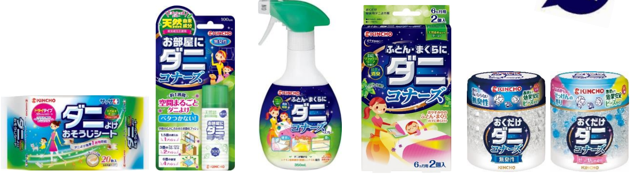
サッサ ダニよけおそうじシート 1プッシュ式 お部屋にダニコナーズ ダニコナーズ スプレー ふとん・まくらに ダニコナーズ ダニコナーズ ビーズタイプ 無臭性／せっけんの香り