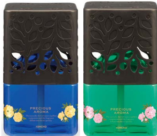
プレミアムブーケ オリエンタルフルーツ

トロピカルなフルーツの基調に バラやクチナシなどの高貴なイメージの フローラルをプラス。 少し甘い、夏にぴったりの香りです。